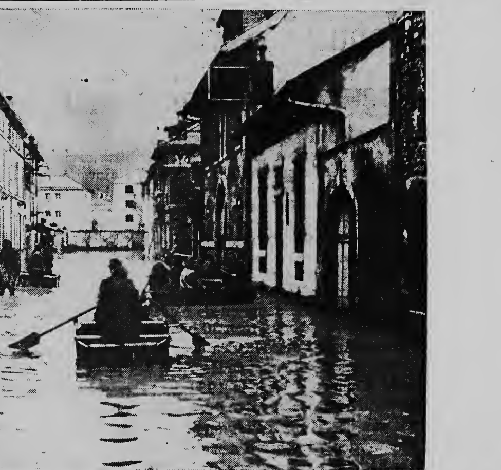
Door cu awa den rionan a subi, dijknan a kibra cerca Verdun, na unda rivier-Maas a cambia cajanen den un laman chiquito. Verdun ta conoci den promé guera mundial pa e gran bataya di Verdun.

"Pero ta paquico awor mi yiu ta manda e respondi ai pa mi? Nan sa mucho bon cu mi n' sa tarda pa yega cas. Probablemente ta e mama ta hopi malo..."